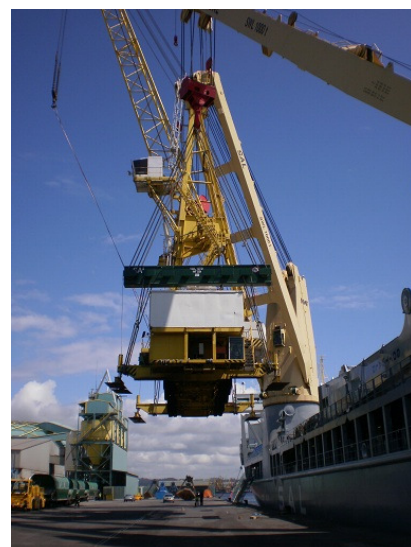
(HMK 300 EG bei der Verladung im Hafen La Coruna)

Die Krane wurden durch die ortsansässige Gottwald Vertretung bei Bestandskunden in der Vergangenheit servicetechnisch betreut. KSR mit Unterstützung der Gottwald Vertretung Spanien wickelte den gesamten Auftrag in kürzester Zeit ab, innerhalb von 4 Wochen nach Beauftragung waren die Krane bereits verladen und befinden sich auf den Weg nach Malaysia. Die Schiffsentladung und Übergabe an den Endkunden übernimmt der malayische Gottwald Servicepartner in Bintulu.