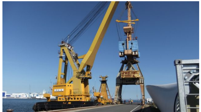
(DWK Kondor bei der Verladung im Hafen Rostock)

Hamburg in eine Werft in England bzw. ein Doppellenker-Wippkran Typ KONDOR von Rostock nach Lettland umgesetzt. Im Augenblick befaßt sich KSR mit dem Umbau / Modernisierung zweier Rohrfachwerk-Portalkrane der Hersteller AUMUND bzw. Wenker. Diese Krane werden in Kürze in Kirgisien bzw. Frankreich zum Einsatz kommen.